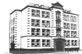
Außenstelle Assenheimer Str. 38-40 (Grundschule)

Email: info@michael-ende-schule.net www.michael-ende-schule.net