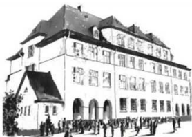
Hauptstelle Niddagastr. 29 (Haupt- und Realschule)